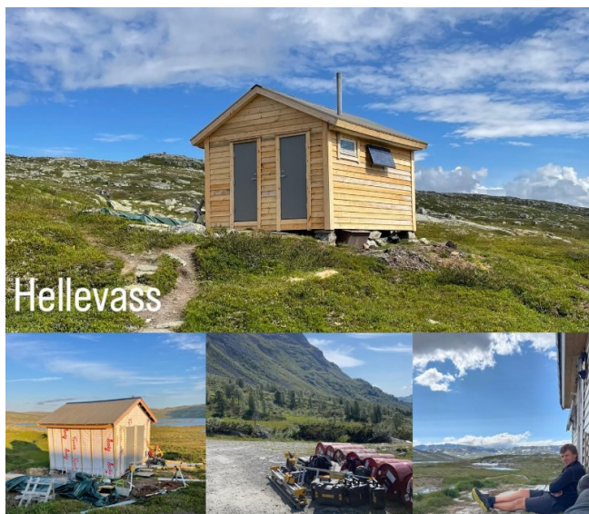
Figur 4: Utvendig renovering av uthuset ved Eriksbu

Planen var å totalrenovere uthuset ved Eriksbu utvendig i løpet av våren 2024. Etter mykje om og med fekk ein tatt torva av taket. Dessverre fekk ein utfordringar når ein skulle bytte kledninga. Det vart difor avgjort at ein berre la nytt tak om våren. Resten vart tatt i løpet av sumarsesongen. Arbeidet vart utført av Olav Hagen og Eirik Sandal. Noko mindre utbetringar vart også gjort inni i hytta.