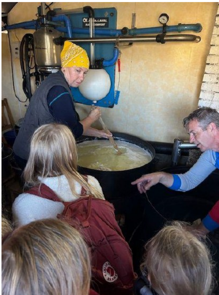
Figur 2: Rekrutteringstiltak hausten 2024. Geitostysting på Midtfjellsvodlen