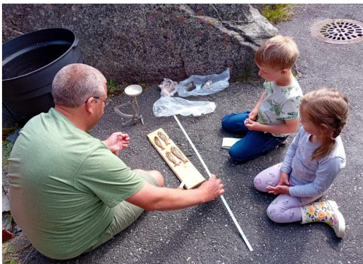
Figur 5: Datainnsamling av sjølvrekruttert fisk

Prøvefisket avslørte at det har vore naturleg rekruttering i Høsingvatnet i 2019. Ein finn også fisk i Nedre Longevotna som truleg ikkje stammar frå