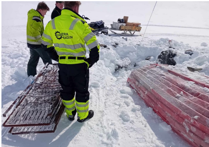
Figur 6: Greitt å ha med senger når ein leitar etter båtar.

Ein prioriterte i tillegg å bruke Hardangervidda fjelloppsyn til å rydde opp i nokre forsøpla lokalisjonar rundt Reinstjørna og Stavsnuten hausten 2023. I løpet av våren 2024 vart mykje av dette transportert ut. Statskog gjekk med på ei kostnadsdeling for gjennomføringa av dette arbeidet, og dekkar kr 26 000 av fjellstyret sine kostnader.