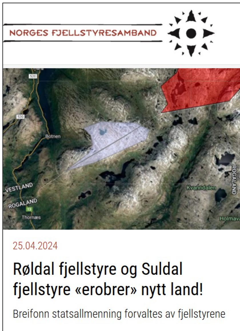
Figur 1: Oppslag på heimesida til Norges Fjellstyresamband

( https://www.fjellstyrene.no/aktuelt/rldal-fjellstyre-og-suldal-fjellstyre-erobrer-nytt-land )