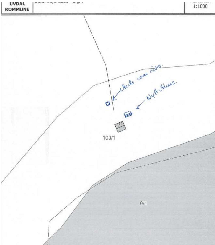
Situasjonsplan i 1:1000