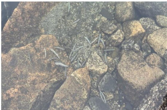
Figur 2. Utsett av fisk i Austre Ripsetjørnane, august 2022.

Det vart sett ut 1350 aureyngel i statsallmenningen. Fisken vart sett ut i Ripsetjørnane austre (300), Ripsetjørnane nord for Ripsebu (300), Øvre Fløyelsevatnet (250), Nedre Fløyelsevatnet (250) og Kvannjolnutvatnet (250). Utsetta vart gjort 9 og 18 august 2022.