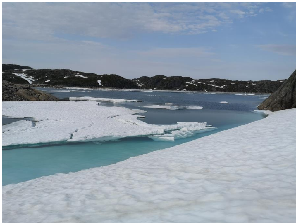
Figur 1. Foto frå Langavatnet 19. juli 2022.

Fiskesesongen i Ulvik statsallmenning vart kort i 2022. Etter ein snørik vinter, var forsommaren prega av mykje dårleg vær og lave temperaturar i fjellet, noko som gjorde at snøsmeltinga gjekk seint. Fleire av vatna var isfrie fyrst i byrjinga av august. Det vart meldt om fiskefangstar på eit middels nivå gjennom sesongen som vara ut september månad.