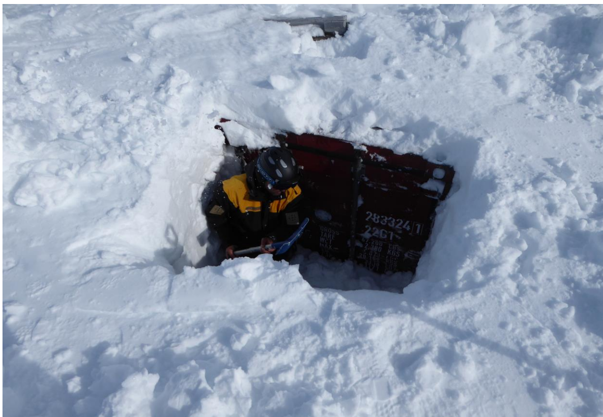
Fjellopsynet spar fram vedkonteineren til Ulvik RKH på Osafjellet.