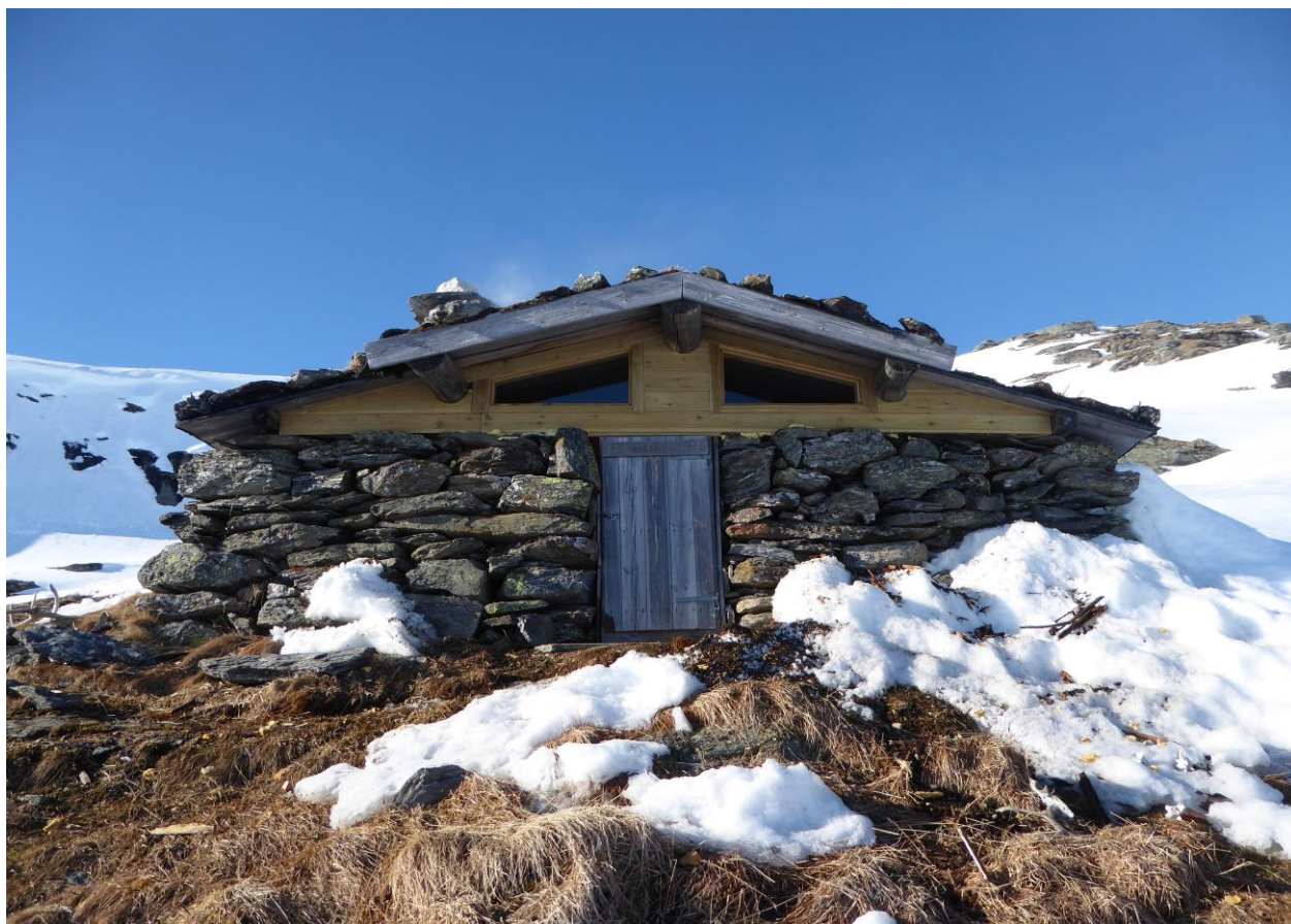
Ny kledning på Lengjedalsbua