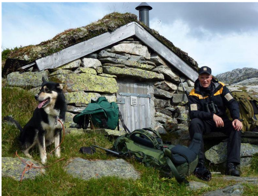
Pust i bakken utanfor Austdølbu