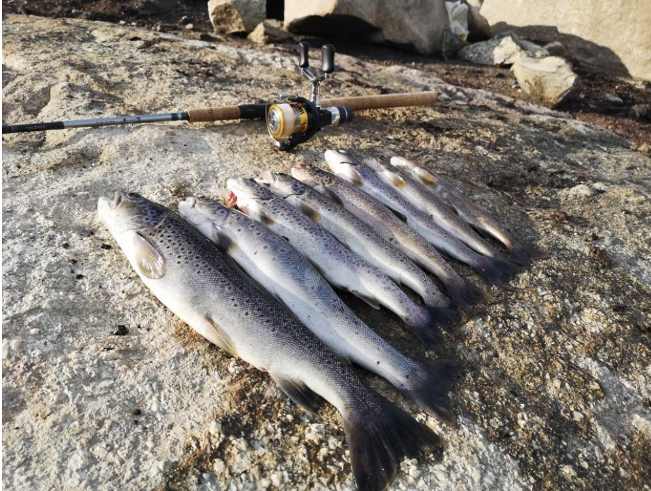
Figur 1. Fiskefangst.

Gjennom sesongen vart det meldt om fiskefangstar på eit middels nivå, og for Langavatnet vart det meldt om til dels gode fangstar. Totalt sett var været gjennom sommaren heller dårleg noko som gjorde at fiskekortsalet endte på eit middels nivå.