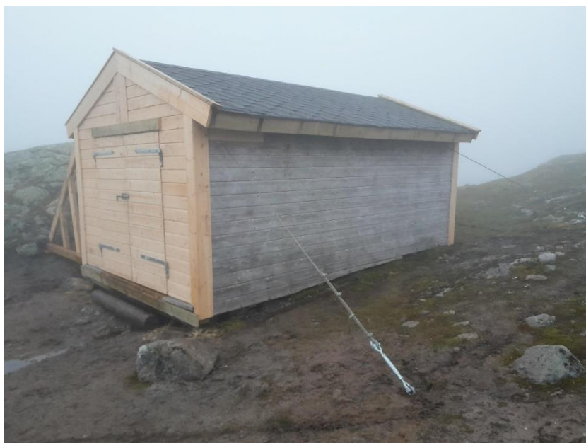
Figur 1. Nauset ved Kvilinganutvatnet er utbeta.

Det har vore høg aktivitet i samband med byggjearbeid/vedlikehaldsarbeid i fjellet. I april vart det skifta vedomn i Dyrahola. Det er transportert inn material til ny utedo i Dyrahola. I juli vart redskapshuset i Søre Grøndal beisa. Det er utført mindre vedlikehaldsarbeid i Søre Grøndalsbu, Ripsebu og Finsebu. I august månad vart det utført reparasjon av nauset ved Kvilinganutvatnet. Bygget vart forsterka og det vart gjort utbetringsarbeid.