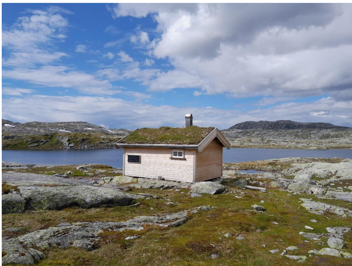
Ripsebu, Ulvik statsallmenning. Juli 2023.