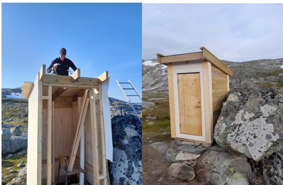
Figur 1. Eirik V. Dørheim frå fjelloppsynet i gang med byggjearbeid i Dyrahola.

Ulvik fjellstyre sin lavvo vart sett ut sommaren 2024 på nordsida av Langavatnet.