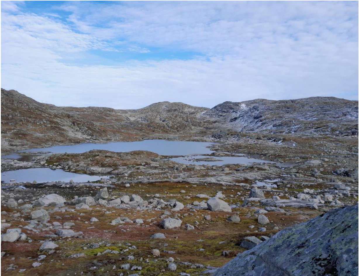
Utsikt over Dyrahola, Ulvik statsallmenning. Oktober 2024.