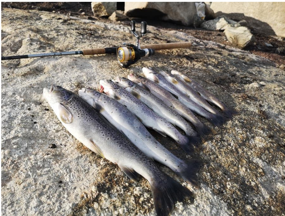
Figur 1. Fiskefangst.

Fiskesesongen i fjellet vert i stor grad påverka av snøtilhøva på vinteren, tidspunkt for is-frie vatn og vær og temperatur gjennom sommaren. Etter ein normal snøvinter, vart mai månad varm og solrik. Snøsmeltinga i fjellet gjorde at dei fleste vatna i allmenningen var is-frie i midten av juli månad. Værtilhøva gjennom sommaren var på eit gjennomsnittleg nivå. Gjennom sesongen vart det generelt meldt om fiskefangstar på eit middels nivå, og i nokre vatn gode fangstar.