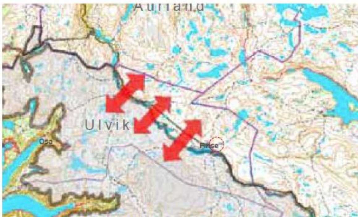
Figur 34. Utsnitt frå Regional plan for Hardangervidda med lokalisering av planområdet.

«Røde piler viser trekk som er viktige for utveksling mot andre nasjonale villreinområder, og trekk med særlig fokus pga. trekkbarrierer. Reinen har viktige trekk for utveksling mot Nordfjella vest for Finse i Ulvik [...]: