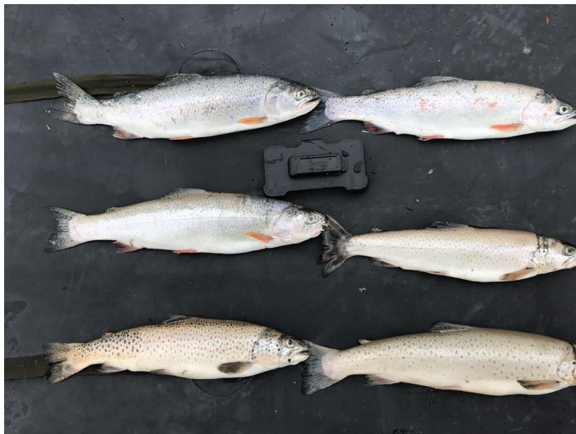
Figur 1: Regnbogaure og vanleg aure frå vatn ved Hårteigen sommaren 2018.

Sommaren 2018 kom det melding om funn av regnbogaure ( Oncorhynchus mykiss ) i eit lite vatn ved Hårteigen. Regnbogaure er ein art som ikkje høyrer heime i Noreg. Innføring av framande artar er eit potensielt trugsmål mot stadeigne artar. Saka blei politimeldt. Som ein del av etterforskinga blei det gjennomført eit prøvefiske i vatnet fisken blei teke i, og to nærliggjande vatn. Det blei funne regnbogaure i alle vatna. Som ein del av etterforskinga blei fisken sendt inn til analyse hjå Havforskningsinstituttet. Analysen kunne ikkje påvise opphavet til fisken, og saka blei henlagt grunna manglande bevis.